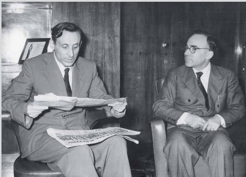
Giuseppe Dossetti (a sinistra) insieme a uno dei suoi più stretti collaboratori, Giorgio La Pira.